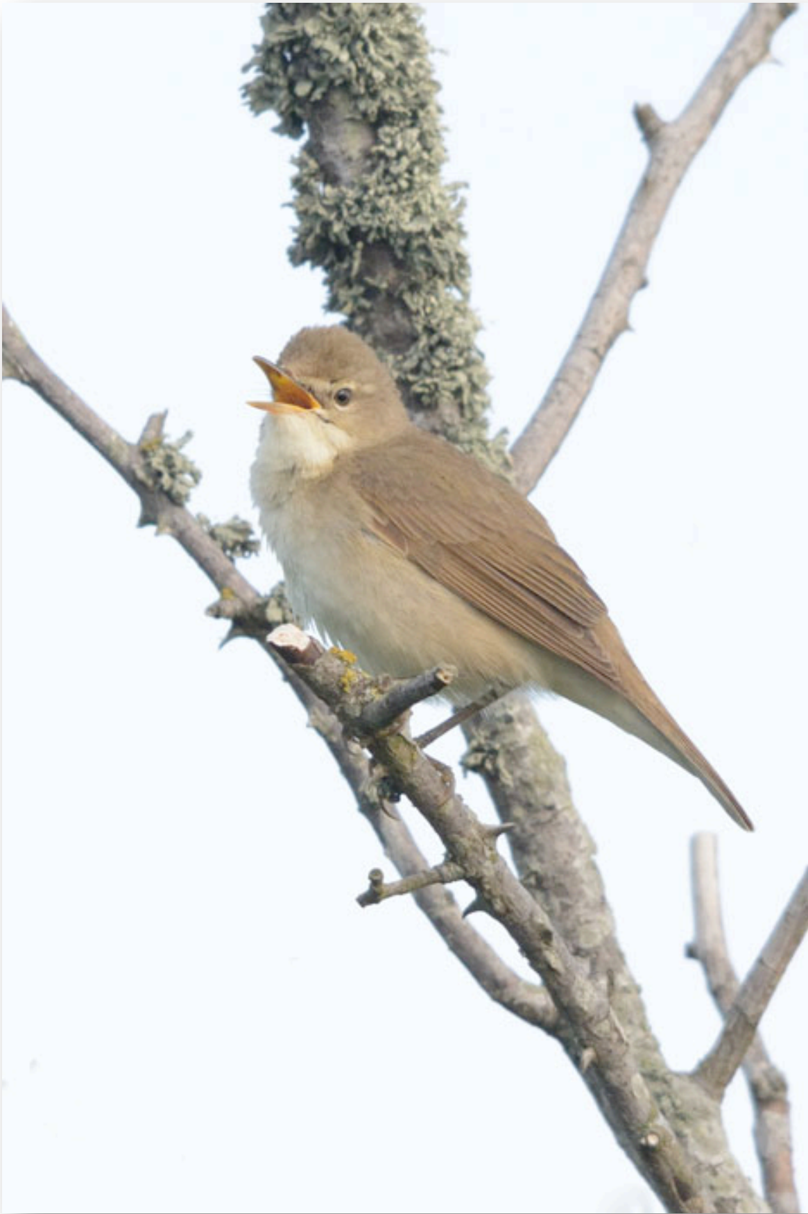
Busksångaren som "höll hov" nere i Rivethagen under flera vårmorgnar.