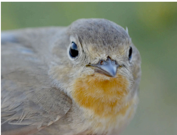
Mindre flugsnappare.

S lutresultat för vårsåsongen 2016 i Sundre blev 2061 ringmärkta fåglar av 55 arter. Genomsnittet för de föregående tio åren är 2114, så man kan inte säga annat än att den var normal. Det som inte var helt normalt när man tänker tillbaka på våren 2016 är det stora antalet ovanliga fåglar som fastnade i näten - dvärgsparvar, rödstripiga sångare, stäppsångare, sommargylling, brandkronad kungsfågel, svart rödstjärt, flodsångare, 10 lundsångare och 22 mindre flugsnappare. Även om vi alla som är involverade i verksamheten i Sundre är barnsligt förtjusta även i de vanliga arterna blir det förstås lite extra guldkant på tillvaron när det kommer oväntat besök! Fågelstationen var bemannad 46 dagar mellan 24 april och 8 juni och 27 personer arbetade ideellt och höll verksamheten igång från tidig morgon. Ringmärkningen utfördes dagligen mellan 25 april och 8 juni från en timme innan soluppgången till kl. 10 på förmiddagen. Väderförhållandena var gynnsamma under den gångna säsongen och endast en dag, 27 april, ställdes ringmärkningen in med anledning av den hårda vinden.