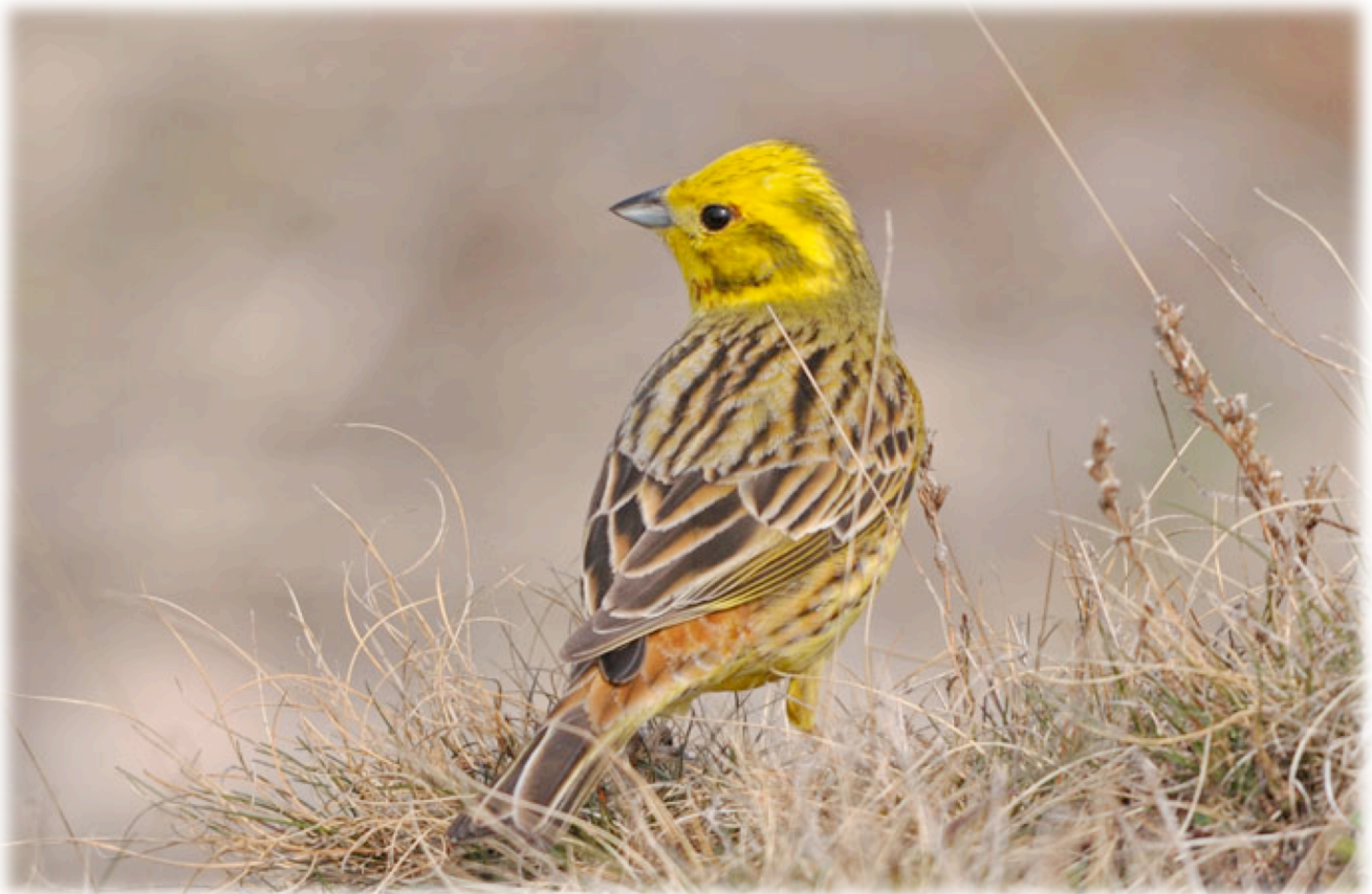
Gulspurv som lyser upp de beiga gräsmarkerna.