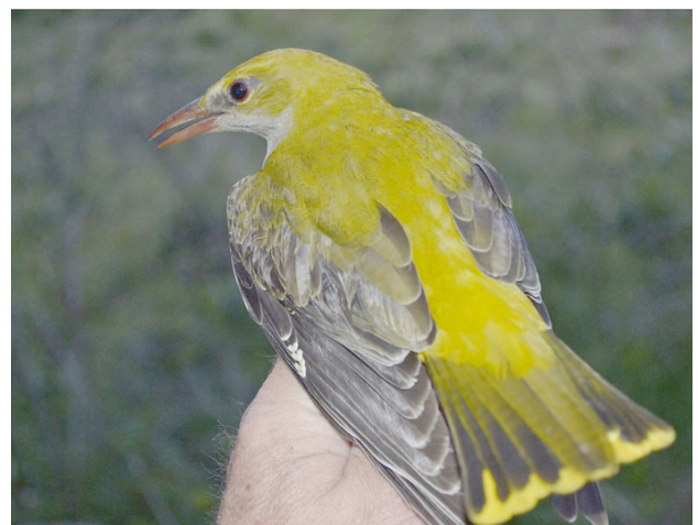
Sommargylling fångad 31 maj.

De vanliga flugsnappararterna - grå, halsbands- och svartvit- märktes alla i antal strax under genomsnittet för de senaste tio åren. Den som sticker ut är mindre flugsnappare där 22 individer ringmärktes, vilket är ovanligt många då medelvärdet är nio. Då har ändå snittet dragits upp då vi hade några goda år även 2013 och 2014 när 27 respektive 22 märktes per vår.