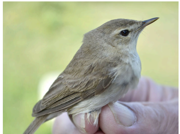
Stäppsångare fångad 31 maj.

Här följer övriga fältobsar från andra halvan av maj. En svartpannad törnskata sågs på Rivet 18 maj och samma dag hördes höksångare sjunga vid Hoburgen. Dagen efter sågs en rastande kornsparv på Rivet. En sommargylling (emellanåt två) ses och hörs vid Hoburgen vid flera tillfällen under resten av månaden. Vid Muskmyr ses en vacker hane aftonfalk från 20 maj och en vecka framåt. Den 25 maj har den fått sällskap av en hona. En ovanligt sen fjällvråk ses vid Hoburgen 21 maj. I branten finns en ortolansparv 24 maj och ett par kaspiska trutar står på Rivet samma dag.