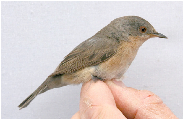
Den rödstrupiga sångaren som fångades 20 maj, troligen en s.k. rostsångare.

Alla vanligt förekommande Sylvia -sångare märktes i antal lägre än genomsnittet för de föregående tio åren, men som bonus gästades vi istället av två rödstrupiga sångare. En 20 maj och sedan en till 3 juni. Endast fyra rödstrupiga sångare har tidigare märkts i Sundre och senast var 2012 innan raserna inom rödstrupig sångare delades upp i tre olika arter: rostsångare, moltonisångare och rödstrupig sångare. Dessa är inte alltid så lätta att skilja från varandra och därmed har de två exemplar som ringmärktes i Sundre denna vår ännu inte fått artillhörigheten bekräftad, men troligen rör det sig i båda fallen om den västliga arten som nu heter rostsångare.