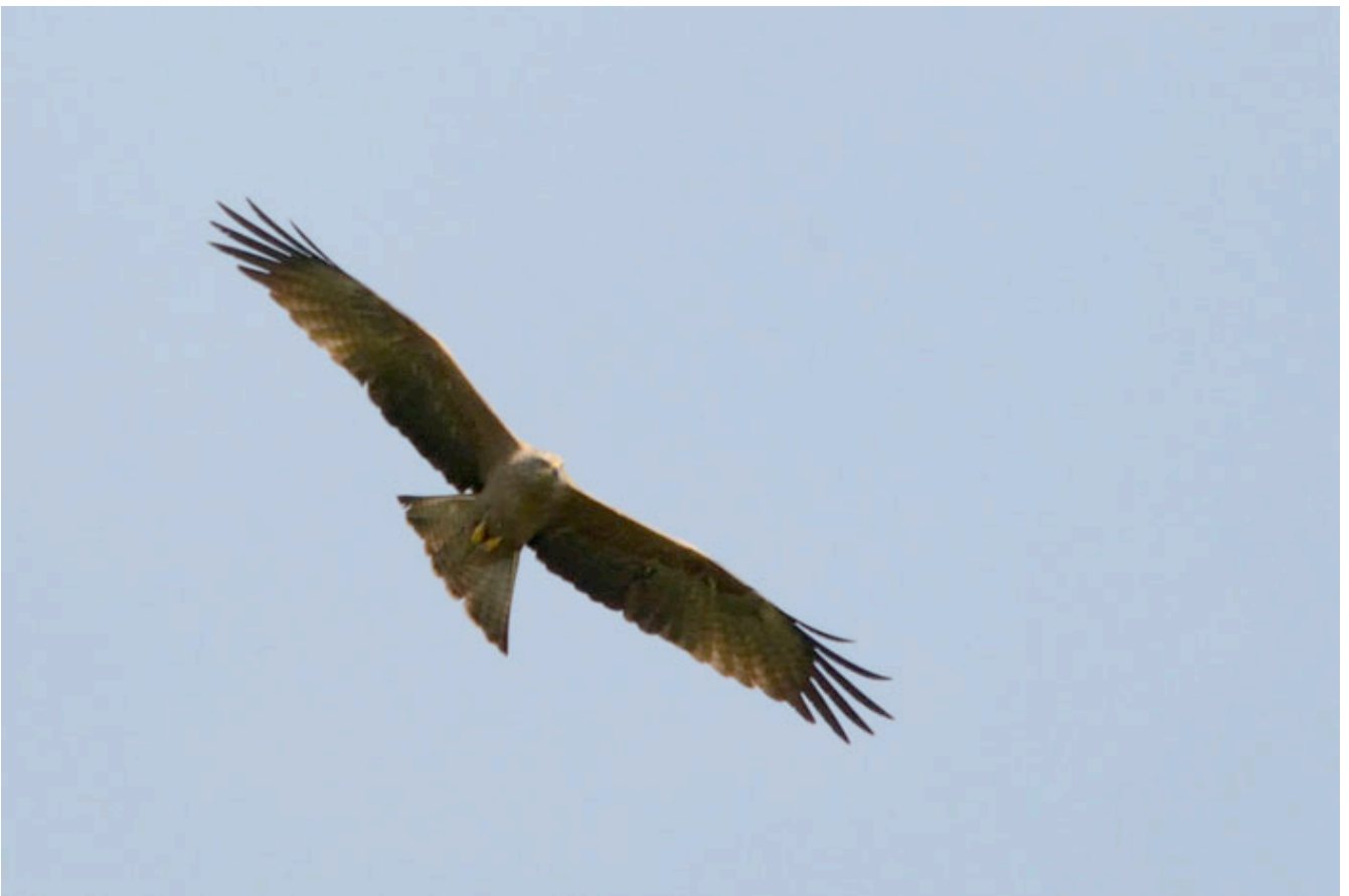
Kanske får du se en brun glada under hösträffen!