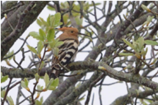
Härfågel vid gödselstacken 13 maj.

I fält observerades biätare både 3 och 12 maj. På morgonen 4 maj stöttes en dubbelbeckasin i nätområdet, men undgick tyvärr att fastna. Senare samma dag sågs ett ringtrastpar längs grusvägen mellan Skoge och Digrans. Med sydvindarna 10 maj kom säsongens första sommargylling som sågs rasta vid Hoburgsklippan.