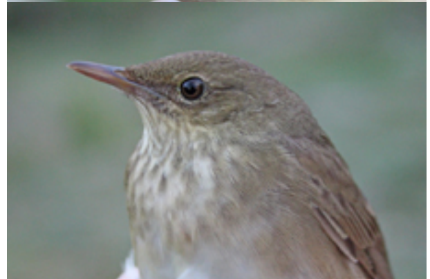
Både busksångare (överst) och flodsångare fångades under våren.