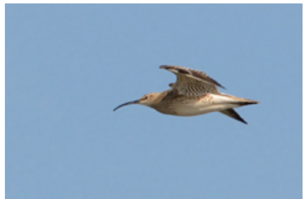
En av småspovarna vid Rivet 30 april.

I fält sågs 29 april en tretåig mås på nordsträck utanför Hoburgen och 30 april rastade en flock med 36 småspovar på Rivet. Kort därefter stöttes en korttålarcka vid Hällarna.