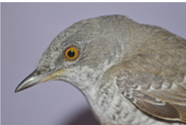
Höksångaren är tyvärr en art som minskar i fångsten.

Alla våra fem Sylviasångare, höksångare undantagen, har märktes i antal över eller precis på genomsnittet under den gångna säsongen (se tabell 2).