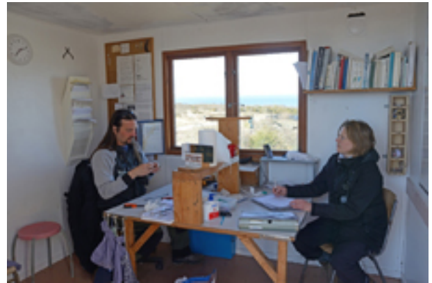
En av många trevliga morgnar "på jobbet".

Finland. Även en järnsparv ringmärkt 7 september 2013 tycks ha fallit offer för en katt i Braunschweig, Tyskland 4 mars påföljande år, då eine Katze spielte mit dem toten Vogel (en katt lekte med den döda fågeln). Till sist en gammal bekant. Några kentska tärnor ringmärktes vid Rivet sommaren 2002. Ringen på en av dessa, med åldersklass 3K+ vid märktillfället, avlästes i Tyskland sommaren 2009. Två år senare var det dags igen, 24 juni 2011 fångades fågeln i Griend, Nederländerna och kontrollerades, således 12K+ eller minst 11 år gammal.